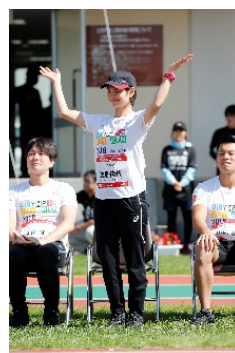
逸見 佳代 氏 (スキー/フリースタイル)