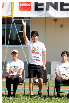
小塚 崇彦 氏 (スケート/フィギュアスケート)