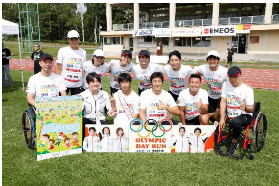
・当選者と記念撮影するオリンピック。