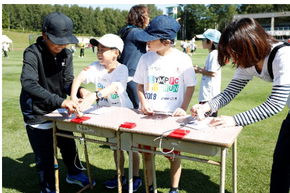
・5カ所をめぐるスタンプラリーを実施。