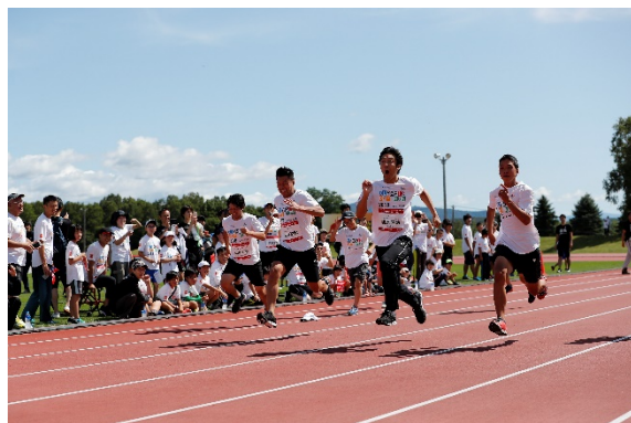
・小塚氏、山口氏も50m競走へ参加。