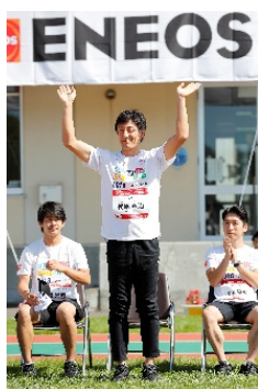
朝原 宣治 氏 (陸上競技)