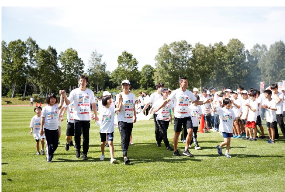
・オリンピック・ムーブメントアンバサダー、オリンピック、パラリンピアンとエスコートキッズが手をつないで入場。