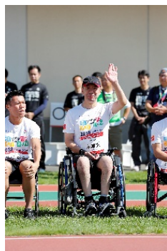
永瀬 充 氏 (パラアイスホッケー)