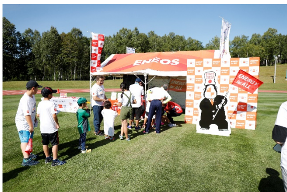
・JOCゴールドパートナーのJXTGエネルギー株式会社によるブース。