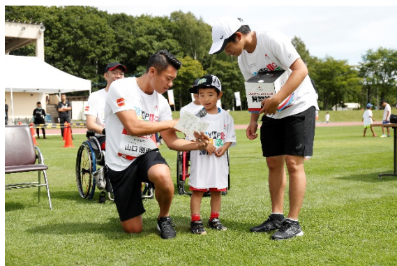
・参加者全員でカーリングポーズをするオリンピック、パラリンピアン。