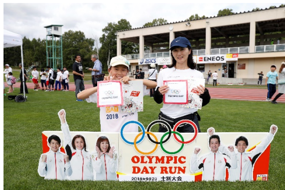
・スタンプラリー達成者にJOCハンドタオル、JXTGノートをプレゼント。