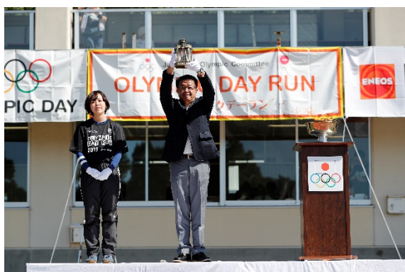
・中峰教育長による採火。