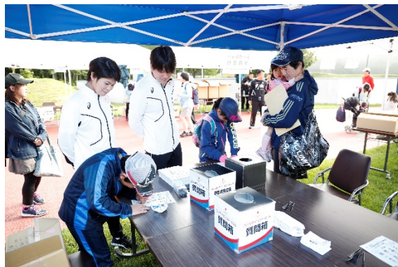
・オリンピックへの質問記入コーナーを設置。