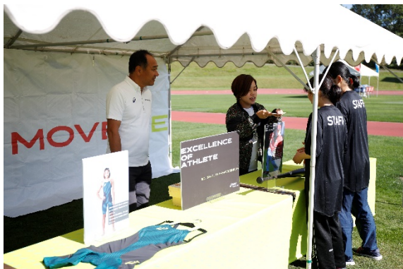
・JOCゴールドパートナーのアシックスジャパン株式会社によるブース。