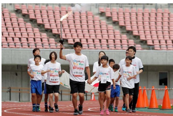
・エスコートキッズがオリンピック・ムーブメントアンバサダー、オリンピックと手をつないで入場。