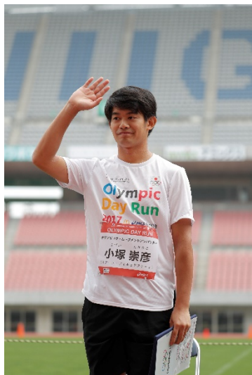
小塚 崇彦 氏 (スケート・フィギュアスケート)