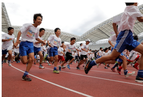
・オリンピックと一緒にジョギング同時スタート。