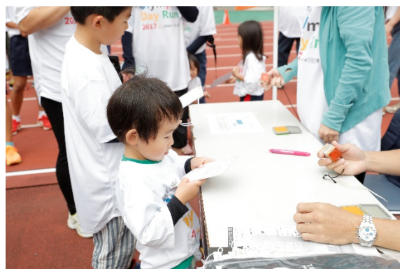
・当日は5つのポイントをめぐるスタンプラリーを実施した。