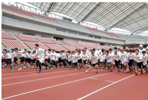
・オリンピックと一緒にジョギング同時スタート。