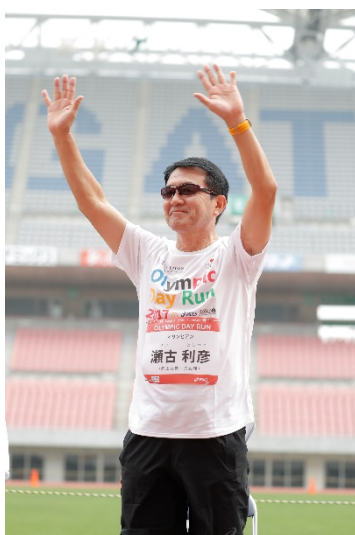
瀬古 利彦氏 (陸上競技・長距離)