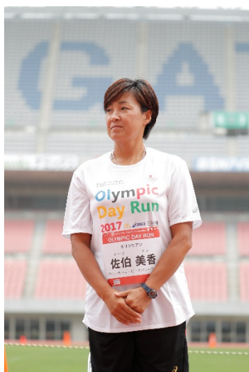
佐伯 美香 氏 (バレーボール・ビーチバレーボール)