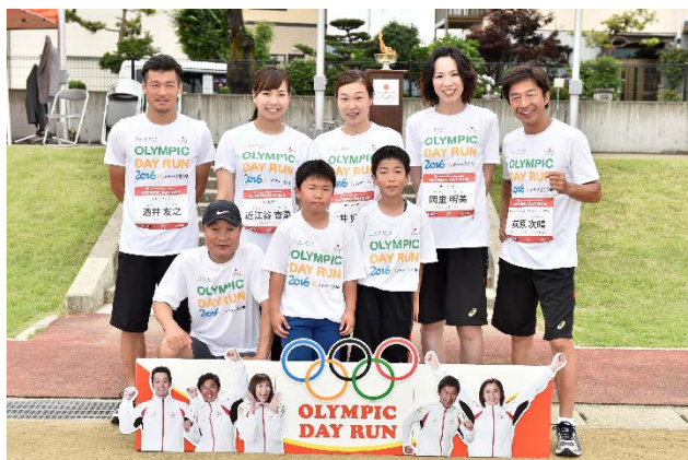
・オリンピックが質問箱から引き当てた質問者と共に。