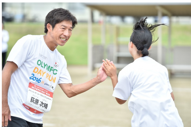
・ゴールではオリンピックとドナルドがハイタッチや大きな声援と共に参加者を迎える。