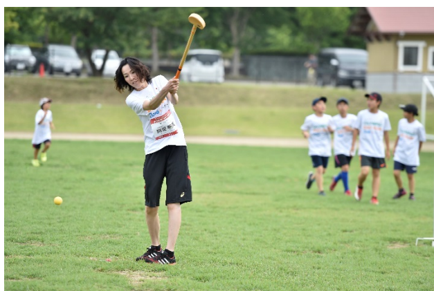
・オリンピックと一緒にスポーツ体験を楽しむ参加者。