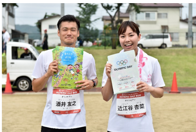
・ゴール後、オリンピックからオリンピズム賞（オリンピックバリュー／価値を紹介するクリアファイル）を贈呈。