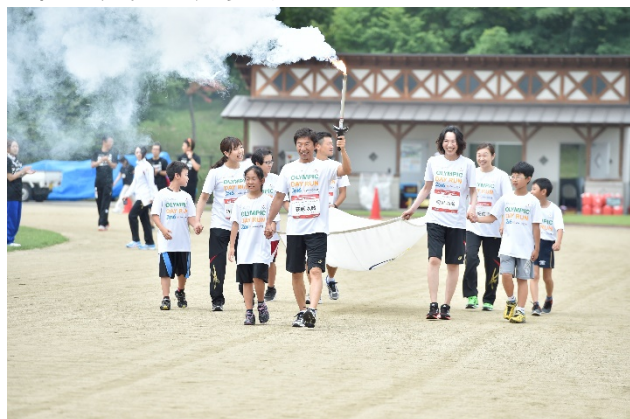
・エスコートキッズがオリンピック・ムーブメントアンバダー、オリンピックと手をつなぎ入場。