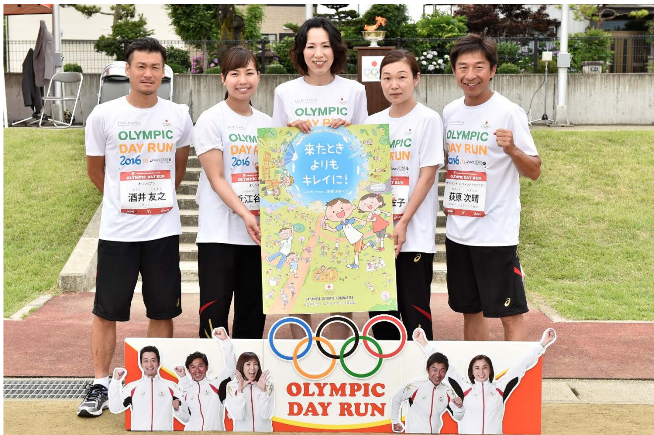
・会場では、スポーツを通じた環境保護の重要性も周知。