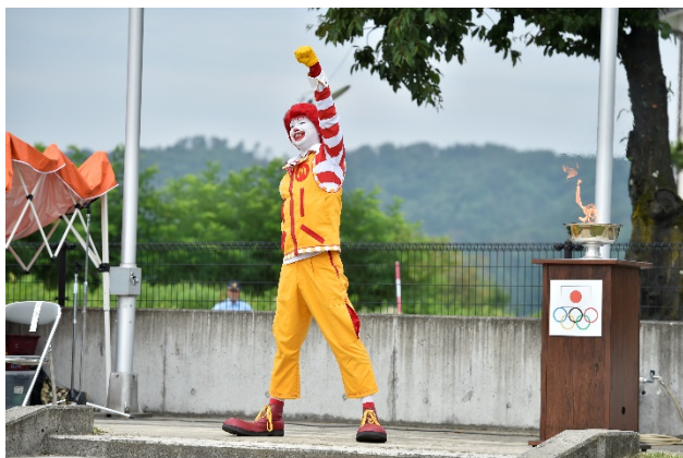
・参加者全員でドナルドと一緒にオリジナル体操を実施。