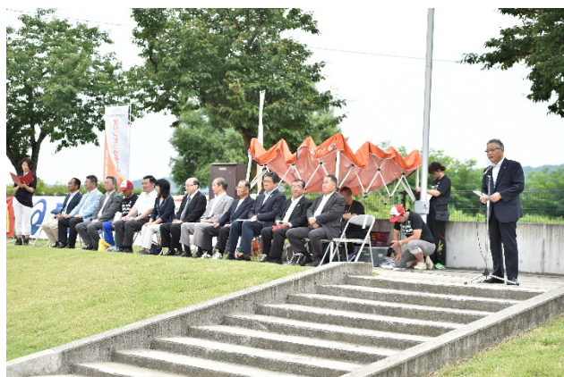
・主催者を代表して、山口 信也 喜多方市長から挨拶。