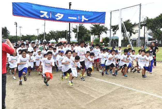
・オリンピックと一緒にジョギングスタート。