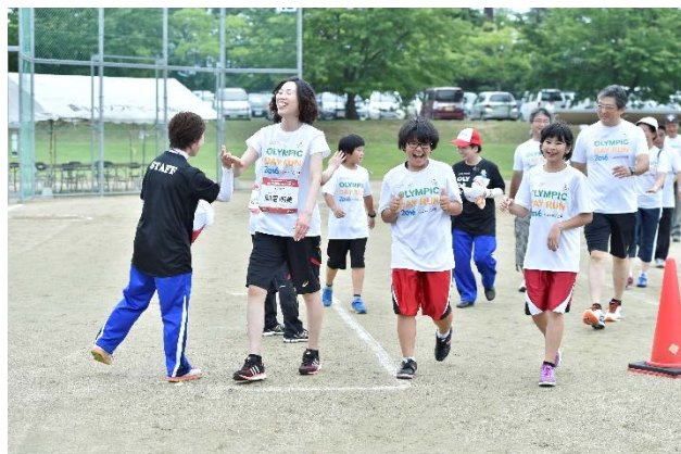
・オリンピックと一緒にウォーキングスタート。