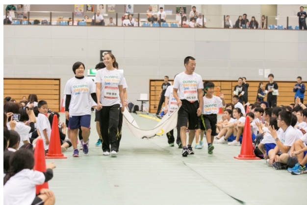
・エスコートキッズがオリンピック・ムーブメントアンバサダー、オリンピックと手をつなぎ入場。