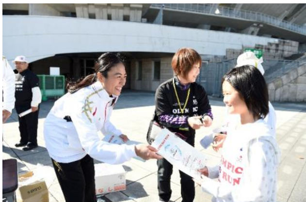
・ゴール後、オリンピックからオリンピズム賞（オリンピックバリュー／価値を紹介するクリアファイル）を贈呈。