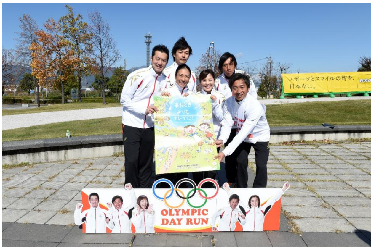
・会場では、スポーツを通じた環境保護の重要性も周知。