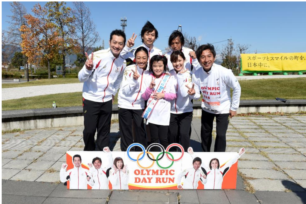
・オリンピアントークショーの際、オリンピアンが質問箱から引き当てた質問を記載した参加者と共にオリンピアン全員が記念撮影。