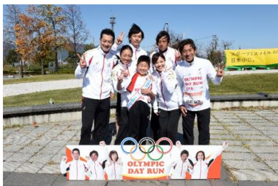
・オリンピアントークショーでオリンピックが質問箱から引き当てた質問者と共に。