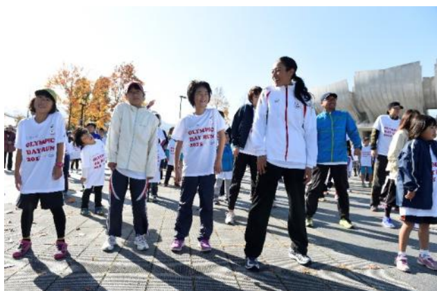
・参加者全員でドナルドと一緒にオリジナル体操を実施。