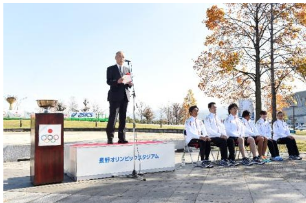
・主催者からの代表挨拶。