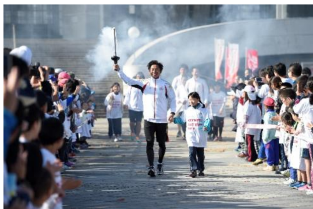
・エスコートキッズがオリンピック・ムーブメントアンバサダー、オリンピックと手をつなぎ入場。