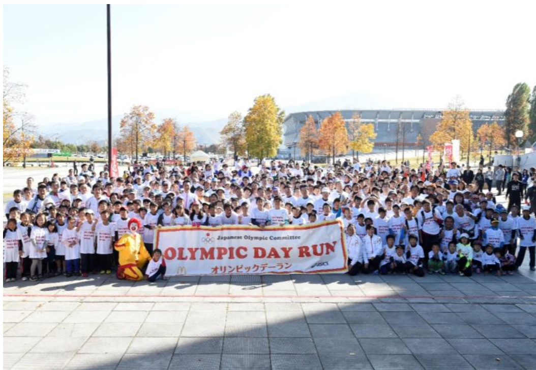
・参加者全員で記念撮影。