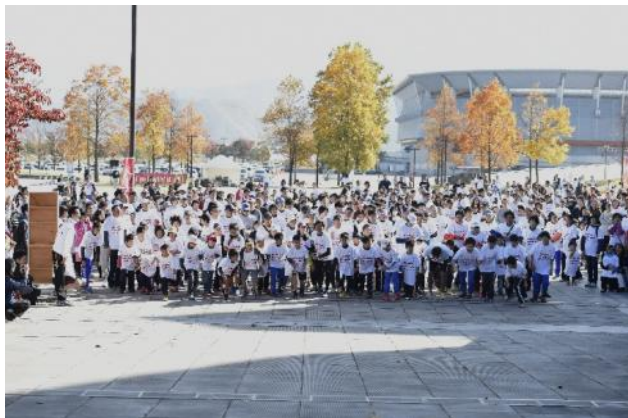
・オリンピックと一緒にジョギング・ウォーキングスタート。