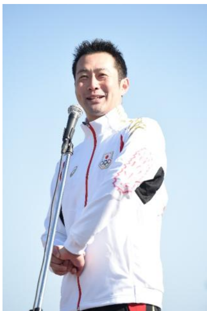
宮下 純一 氏 (水泳・競泳)