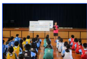
自己紹介 今日の学習内容の確認