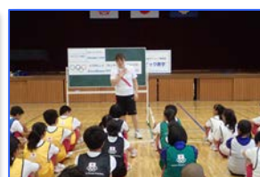
運動の授業のまとめ