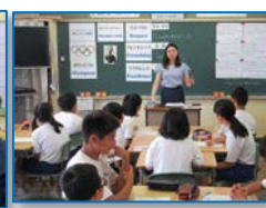
全体のまとめ/記念撮影