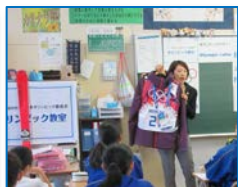
写真・映像等を使用 した自己紹介