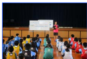
自己紹介 今日の学習内容の確認