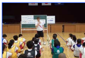
運動の授業のまとめ