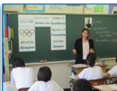
オリンピック自身の経験に 基づく「オリンピックの価値」等 を伝える