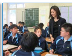
グループ（個人）ワークで 話し合った内容を発表